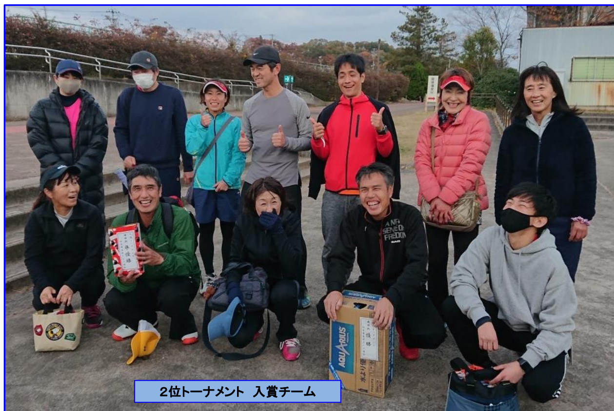
2位トーナメント 入賞チーム