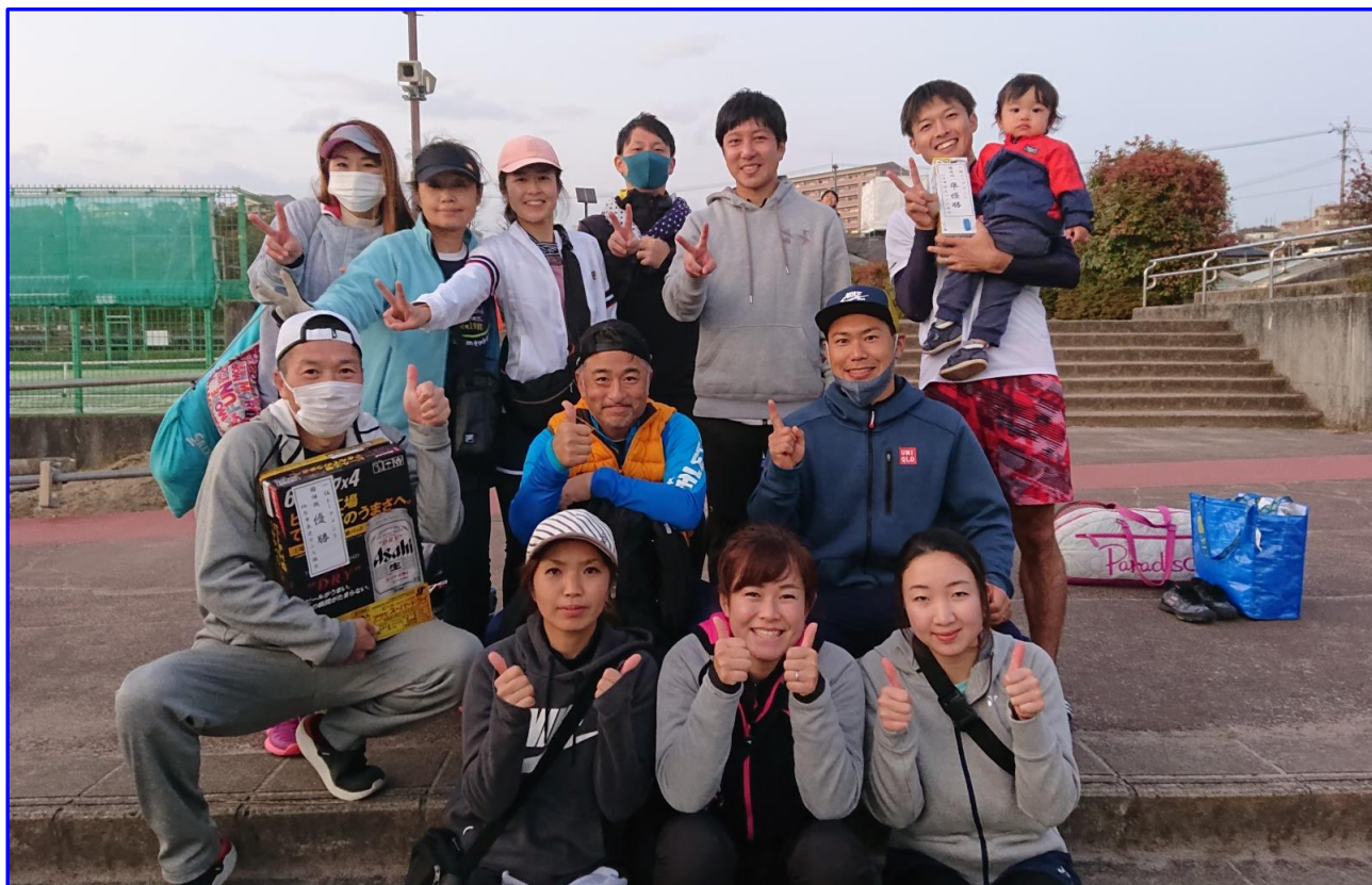
1位トーナメント 入賞チーム